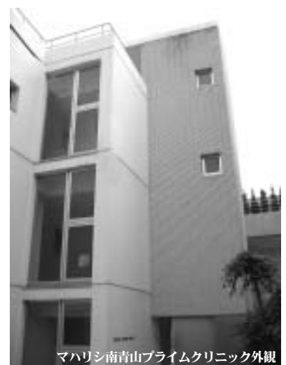
マハリシ南青山プライムクリニック外観