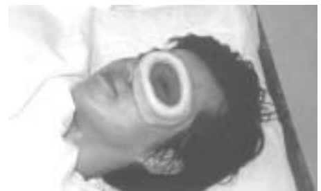
ネトラ・タルバナ

ヴェーダ健康法による対処法は、ヴァータを乱さない養生法を生活に取り入れ、とくに神経系のヴァータを乱さないよう心がけ、緊張してまばたきが減ってきたら休息を十分とり、夜間は目の酷使を避けることです。就寝前には、ギー（精製無塩バター）をまぶたに塗り、こめかみにも塗ってこめかみについては少しマッサージします。さらに、ローズウォーター（バラ水）を湿らせたカット綿を目の上に5分程度置いてから眠ります。また、まぶしくない朝日や夕日を見ることも目によく、目で見ていてリフレッシュできるような風景や環境をながめることも目のストレスを軽減します。目は脳神経が直接外界に露出している感覚器ともいわれ、もともとピッタに主座をおきます。日々目を酷使することでピッタに乱れが生じた場合には、目の浄化療法としてネトラ・タルバナが必要になります。