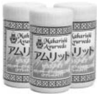
1月分約60粒（約60g）入り 7500円（消費税別）

ジャスミンティーを飲みながら、ナイトジャスミンのインセンスを焚き、頭部に煙を当てて実験するチョットおでこが広がってきたペンギン博士でした。