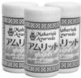
1月分約60粒(約60g)入り 7500円(消費税別)

数年前に癌に対する免疫力を高める作用がバナナにあるという研究が日本癌学会で発表されて以来、人気復活のバナナ。炭水化物やミネラルが豊富で、すぐにエネルギーに転換されるという研究もあり、スポーツ選手にも大人気です。最近ではオーガニック・バナナも大手スーパーに並ぶようになって、バナナ好きのペンギン博士にとっては嬉しい限りです。ただし、バナナは食べ過ぎるとカパが悪化するのでご注意下さい。